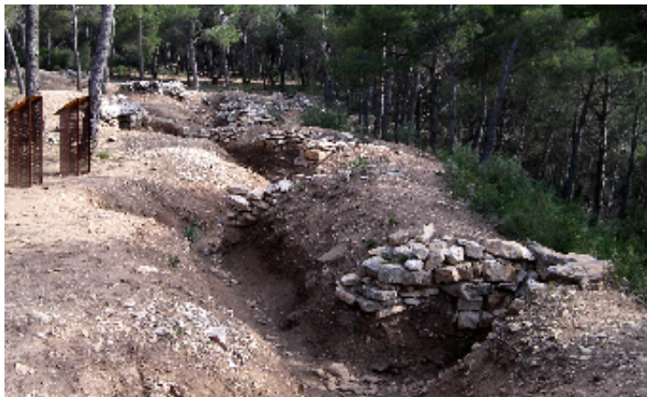
OBSERVATORI DEL PAISATGE