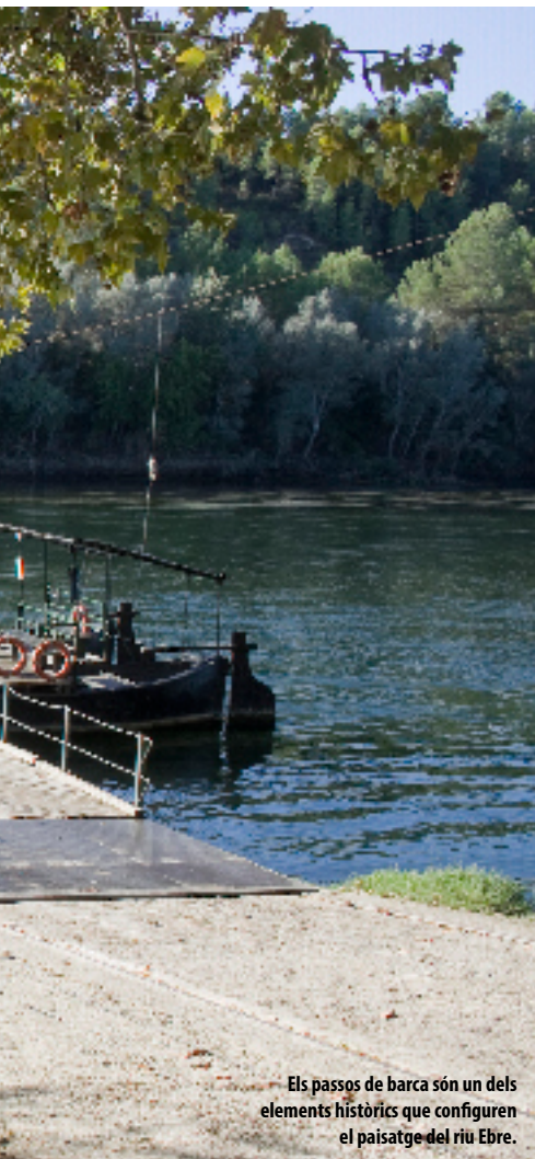
— Els passos de barca són un dels elements històrics que configuren el paisatge del riu Ebre.

te entre la massa d'aigua dolça del riu i la massa d'aigua salada del mar, a més de la presència d'una densa xarxa de canals de reg que es distribueixen per tot el delta fins a les basses i llacunes més pròximes a la desembocadura, que formen part del Parc Natural del Delta de l'Ebre.