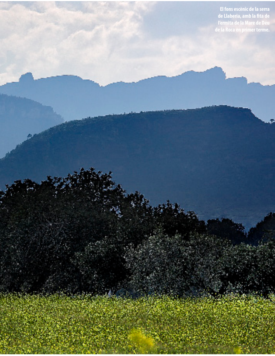
El fons escènic de la serra de Llaberia, amb la fita de l'ermita de la Mare de Déu de la Roca en primer terme.

Malgrat totes aquestes oscil·lacions i transformacions, i el declivi generalitzat del món rural, encara avui en dia existeixen mostres d'aquest tipus de paisatge en alguns indrets del Camp de Tarragona. On està més ben representat és al centre i nord de la conca de Poblet, per bé que la vinya també hi ocupa un paper destacat.