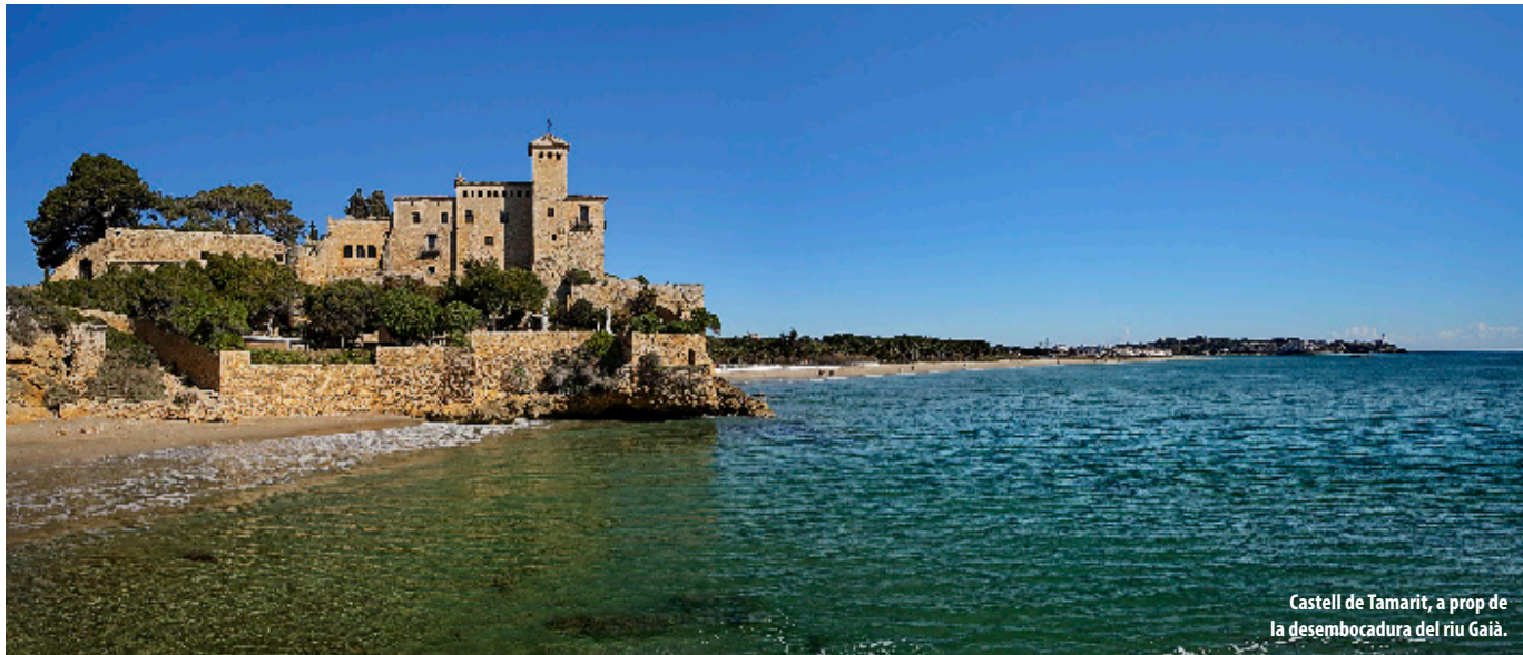
Castell de Tamarit, a prop de la desembocadura del riu Gaià.