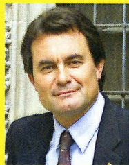
Artur Mas i Gavarró Conseller en cap

El Govern de la Generalitat aposta perquè el transport col·lectiu es converteixi en una alternativa cada dia més atractiva per anar a treballar, per anar a estudiar, o per anar a divertir-nos. Apostem perquè Catalunya sigui un país en moviment.