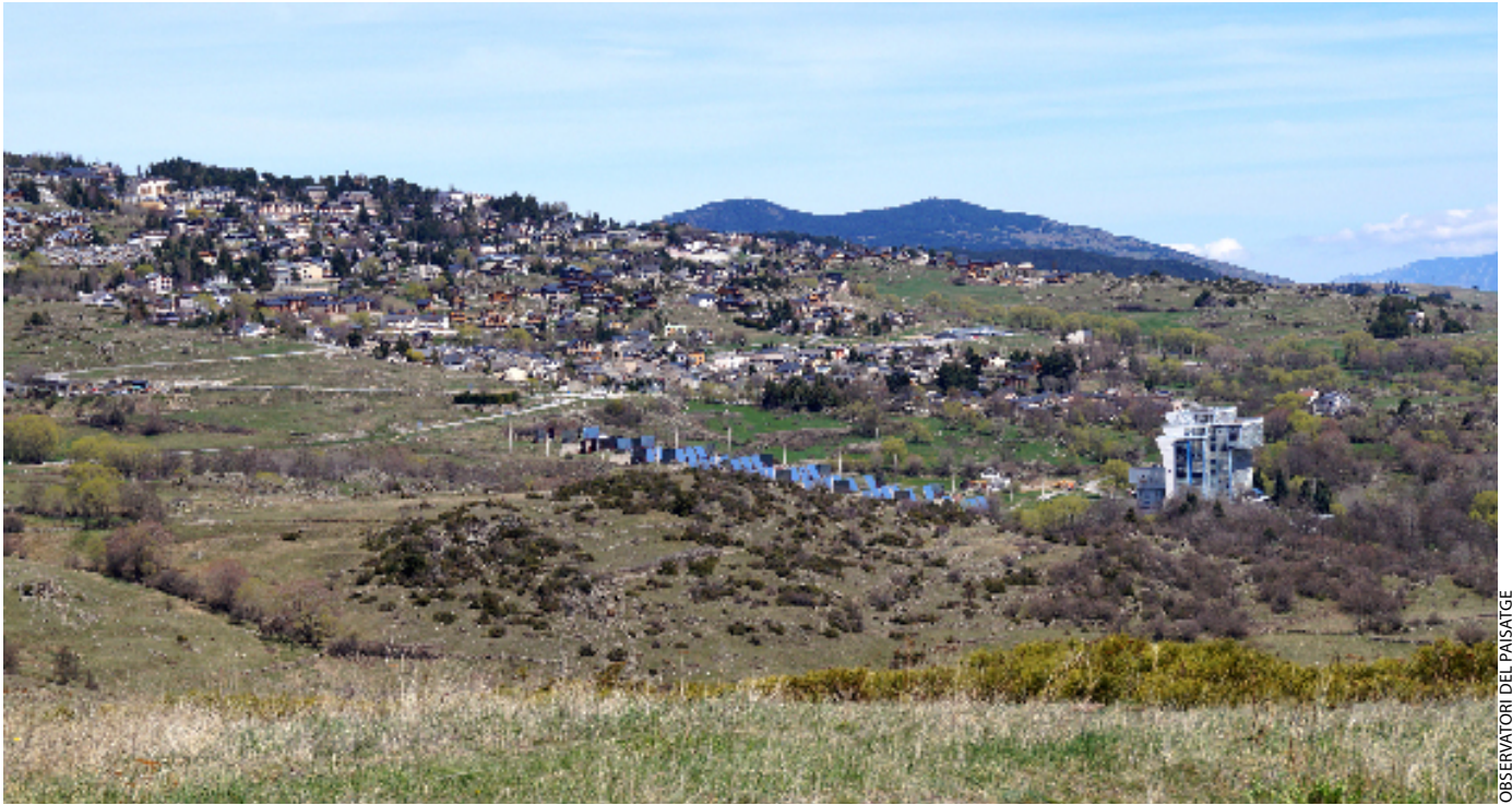
OBSERVATORI DEL PAISATGE

i serres d'entre 2.500 i 3.000 metres, com ara el Puigpedrós, la Tosa d'Alp, el Cadí o el Puigmal.