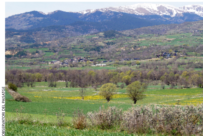
OBSERVATORI DEL PAISATGE

La plana està dominada pels paisatges agraris, estructurats amb la closa cerdana (a l'esquerra). El web del Pla de paisatge transfronterer de la Cerdanya http://paisatgecerdanya.parc-pyrenees-catalanes.fr/ recull totes les novetats i documents relacionats amb el projecte. El paisatge turístic, on es vinculen conjunts residencials sovint poc integrats en el paisatge, s'ha desenvolupat majoritàriament al voltant dels dominis esquiables (a la dreta).